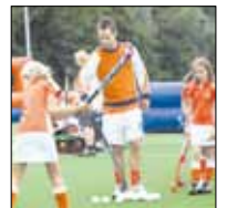
Spirit is geen vreemde voor hockeylessen met kleintjes

sport. Kinderopvang Mundo heeft zich verbonden als sponsor van deze Kids Club. Mundo is één van de grootste kinderopvang-organisaties in de regio met vesti-