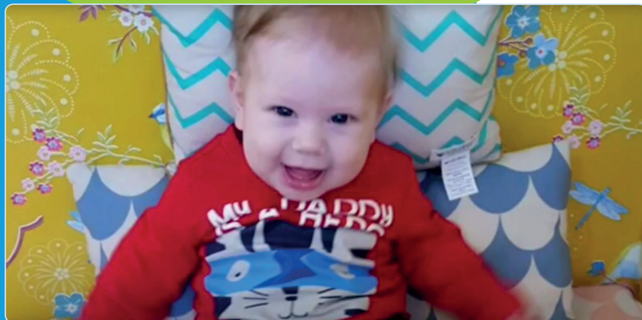
Bekijk film Babygroep Plesant