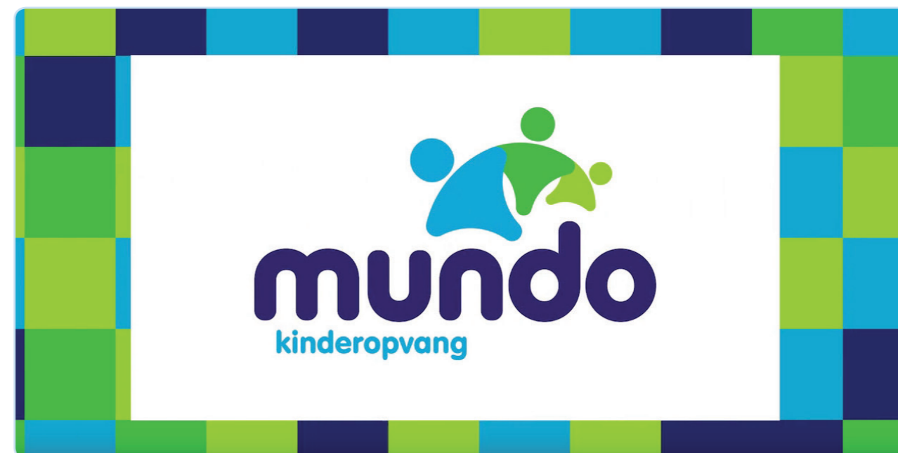
Bekijk mundo movie